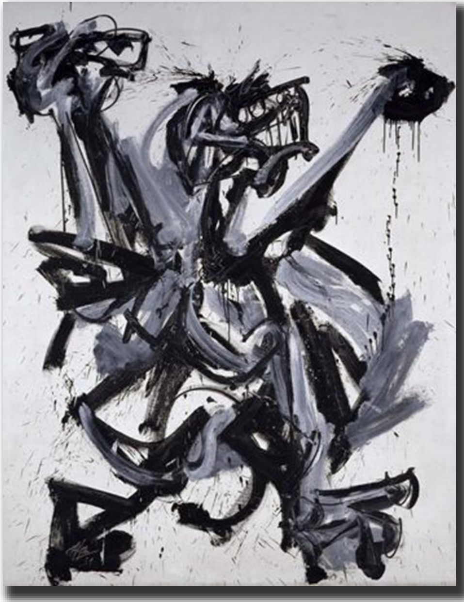
El Grito nº 7 de Antonio Saura. Expresionismo Abstracto. La imagen aparece en el bloque Historia del Arte 05-Historia del Arte Contemporáneo.