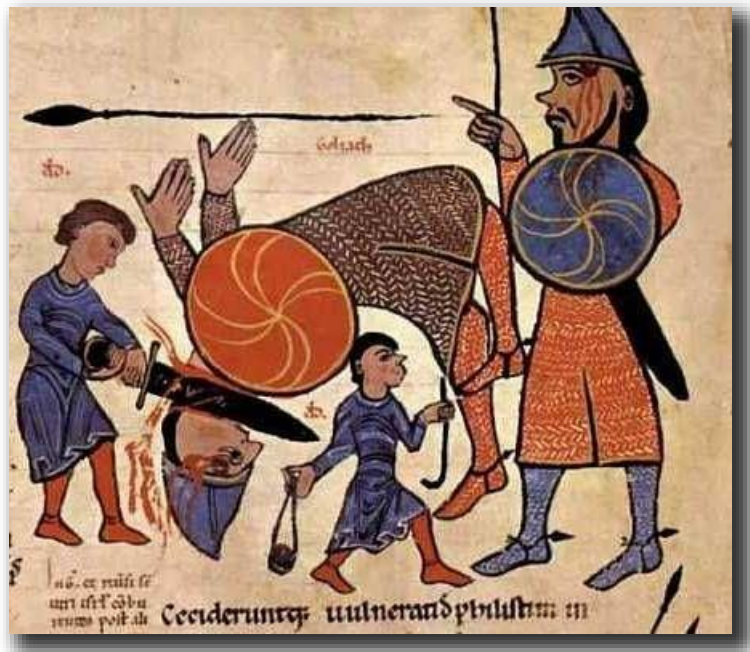
Miniatura de la Biblia Románica San Isidoro de León (1162), escena del David y Goliat. Se trata de una revisión del Codex Biblicus Legionensis o Biblia de San Isidoro del año 960 que se conserva en la Colegiata de San Isidoro de León. Bloque Historia del Arte 03-Historia del Arte Medieval.