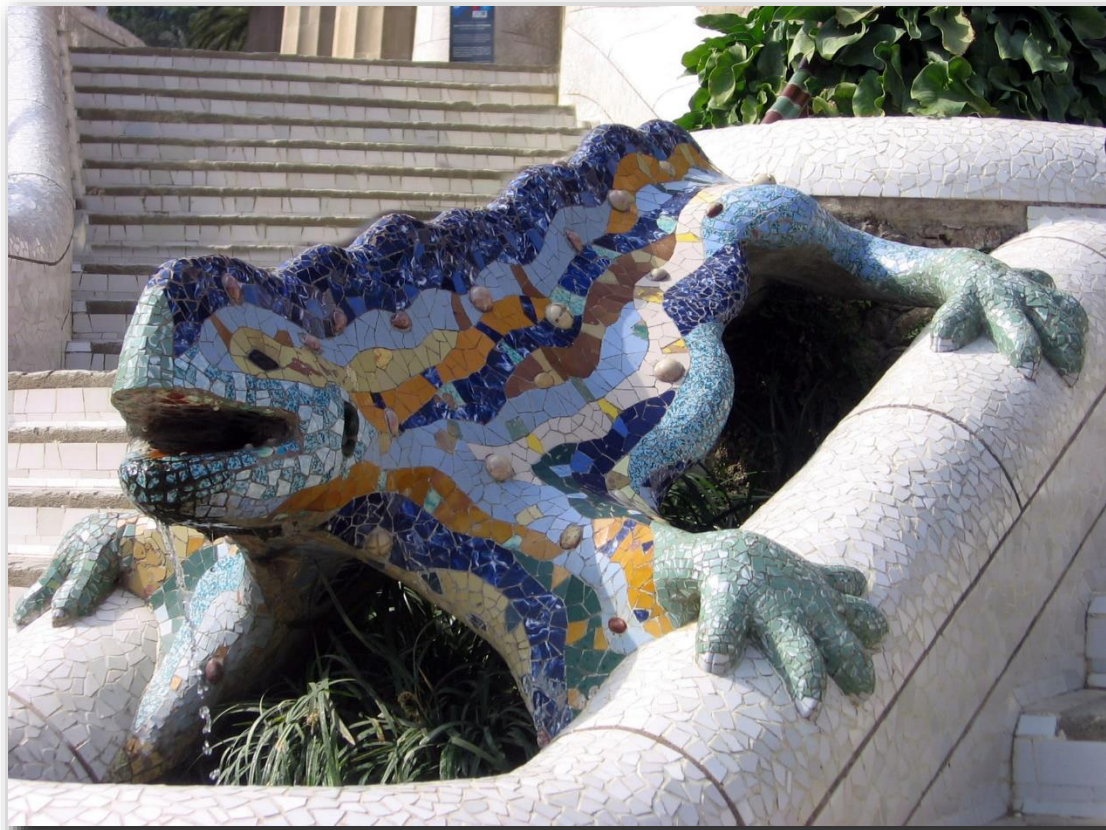
Dragón de la escalinata, parque Güell diseñado por Antonio Gaudí, Barcelona. La imagen aparece en el bloque Historia del Arte 05-Historia del Arte Contemporáneo.