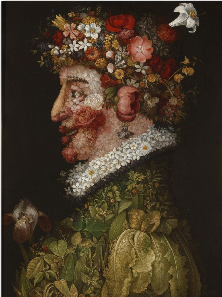
La primavera. Arcimboldo, 1573. La imagen aparece en el bloque Historia del Arte 04-Historia del Arte Moderno.