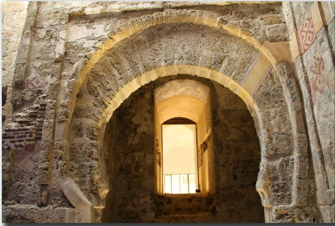
Puerta califal de Ceuta. La imagen aparece en el bloque Historia del Arte Regional Ceuta.