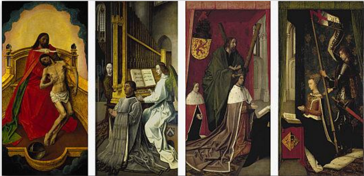
Altar de la Trinidad (finales del siglo XV), de Hugo Van der Goes. Estilo gótico flamenco. Actividad resuelta en el bloque Historia del Arte 03: Historia del Arte Medieval.