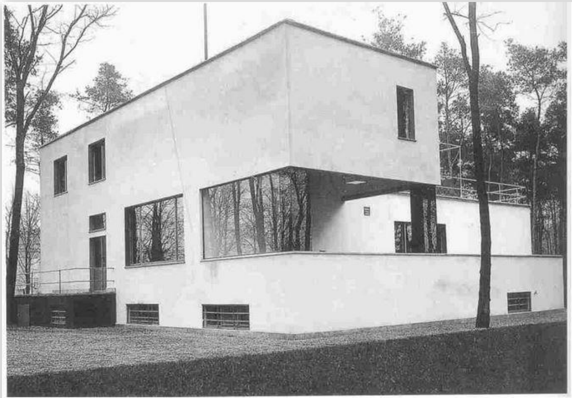
Casa de Gropius en Bauhaus, Dessau. Obra de Walter Gropius realizada entre 1925-6, estilo internacional, racionalismo metodológico-didáctico. Actividad resuelta en el bloque Historia del Arte 05-Historia del Arte Contemporáneo.