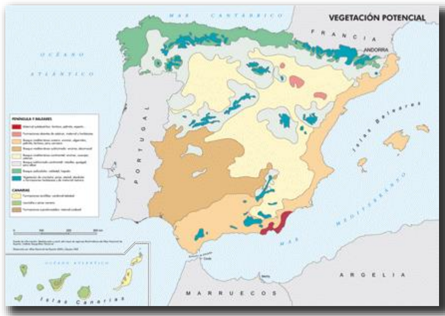
Mapa corocromático que registra la vegetación en España. Actividad resuelta en el bloque Geografía 05-Hidrografía y vegetación.